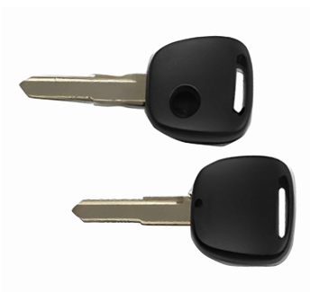
1 ボタン B ヘッド M421