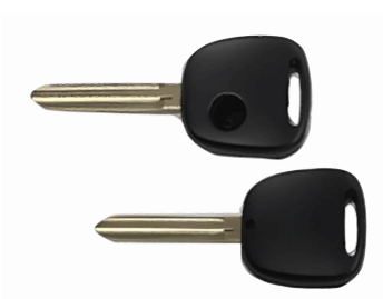
1 ボタン B ヘッド M382