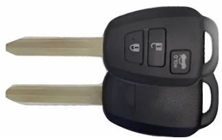
3 ボタン C ヘッド V812(M382)