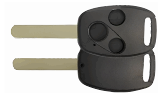
3 ボタン A ヘッド VD33(MT-7) カッターNo.3 使用