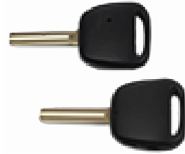
サイド 2 ボタン VD22(MT-6)