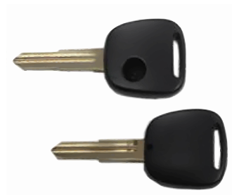
1 ボタン B ヘッド M366、M367