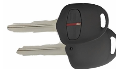
2 ボタン A ヘッド M373