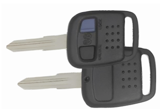
2 ボタン A ヘッド V816(M301)