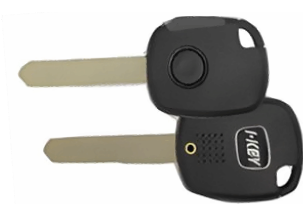
1 ボタン B ヘッド VD33(MT-7) カッターNo.3 使用