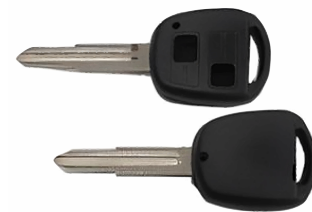
2 ボタン A ヘッド M357