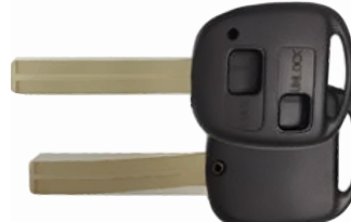
ボタン A ヘッド VD21(MT-2) カッターNo.4 使用