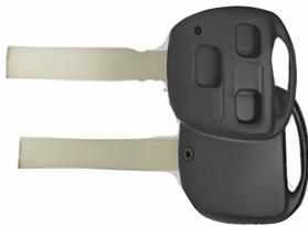
3 ボタン A ヘッド VD21(MT-2) カッターNo.4 使用