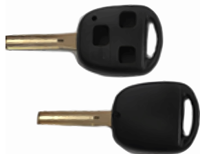
3 ボタン A ヘッド VD22(MT-6)