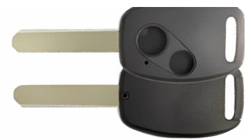
2 ボタン A ヘッド VD33(MT-7) カッターNo.3 使用