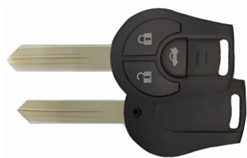
3 ボタン C ヘッド V818(M396)