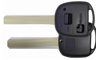
2 ボタン A ヘッド VD21(MT-2) カッターNo.4 使用