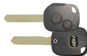
2 ボタン B ヘッド VD33(MT-7) カッターNo.3 使用