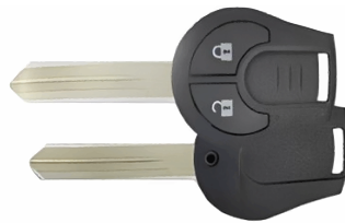
2 ボタン C ヘッド V818(M396)